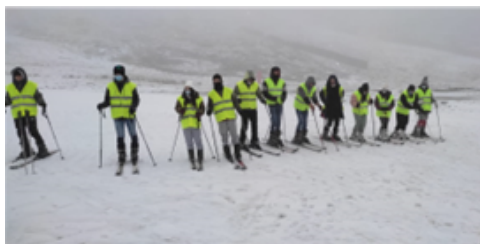
Serra da Estrela (Estância de Ski) - abril de 2022