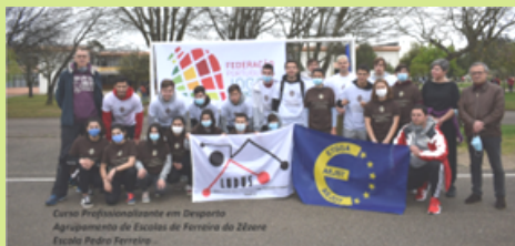
Atividade com Faculdade de Desporto de Coimbra