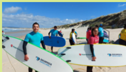
Peniche - Surf - abril 2022