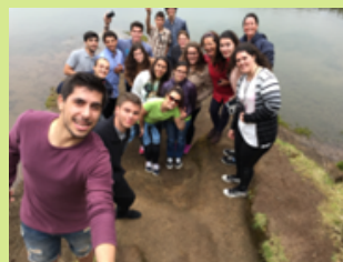
Açores - S.Miguel

Escola Pedro Ferreiro 249360010 direcao@afzezere.edu.pt